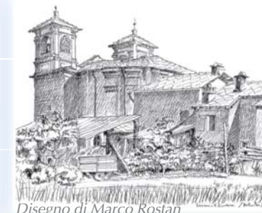
Disegno di Marco Rostan

Diacono: Dario Tron dtron@chiesavaldese.org